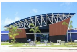
Policlínica de Narandiba