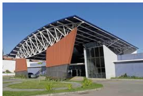
Policlínica de Escada