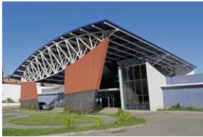
Policlínica de Escada