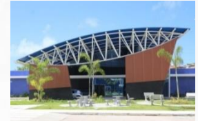
Policlínica de Narandiba